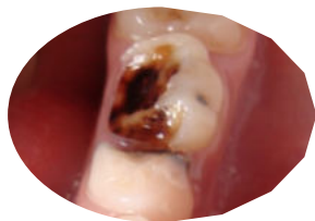
Lésions carieuses cavitaires